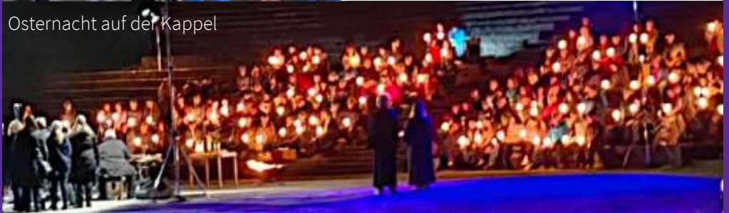
Osternacht auf der Kappel